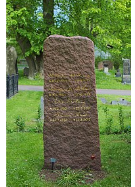
Vilhelm Mobergs gravvård på Norra begravningsplatsen i Stockholm.