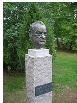
Skulptur av Vilhelm Moberg utanför Utvandrarnas Hus i Växjö.