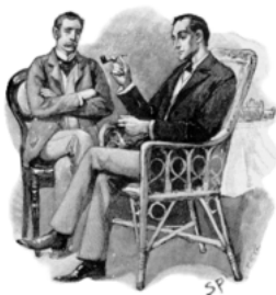
Sherlock Holmes (till höger) och Doktor Watson, av Sidney Paget.